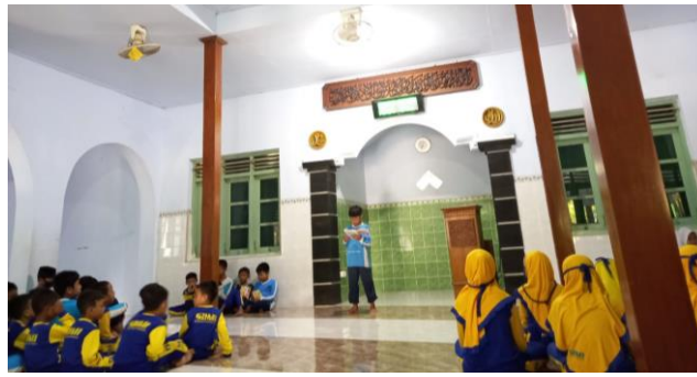
Gambar 1. Pelaksanaan Kegiatan Muhadhoroh