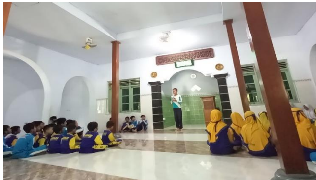
Gambar 2. Pelaksanaan Kegiatan Muhadhoroh